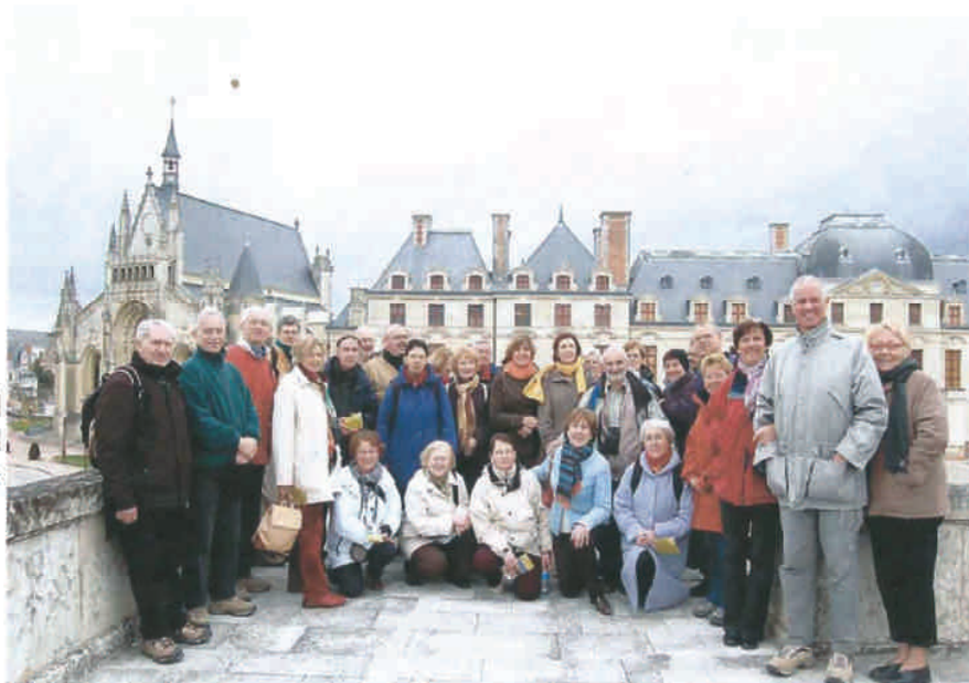
Le Maître et ses élèves (un peu fourbus !!)

Ps : Un grand merci à tous les participants. La préparation de ces 2 journées m'a aidé à entretenir le moral