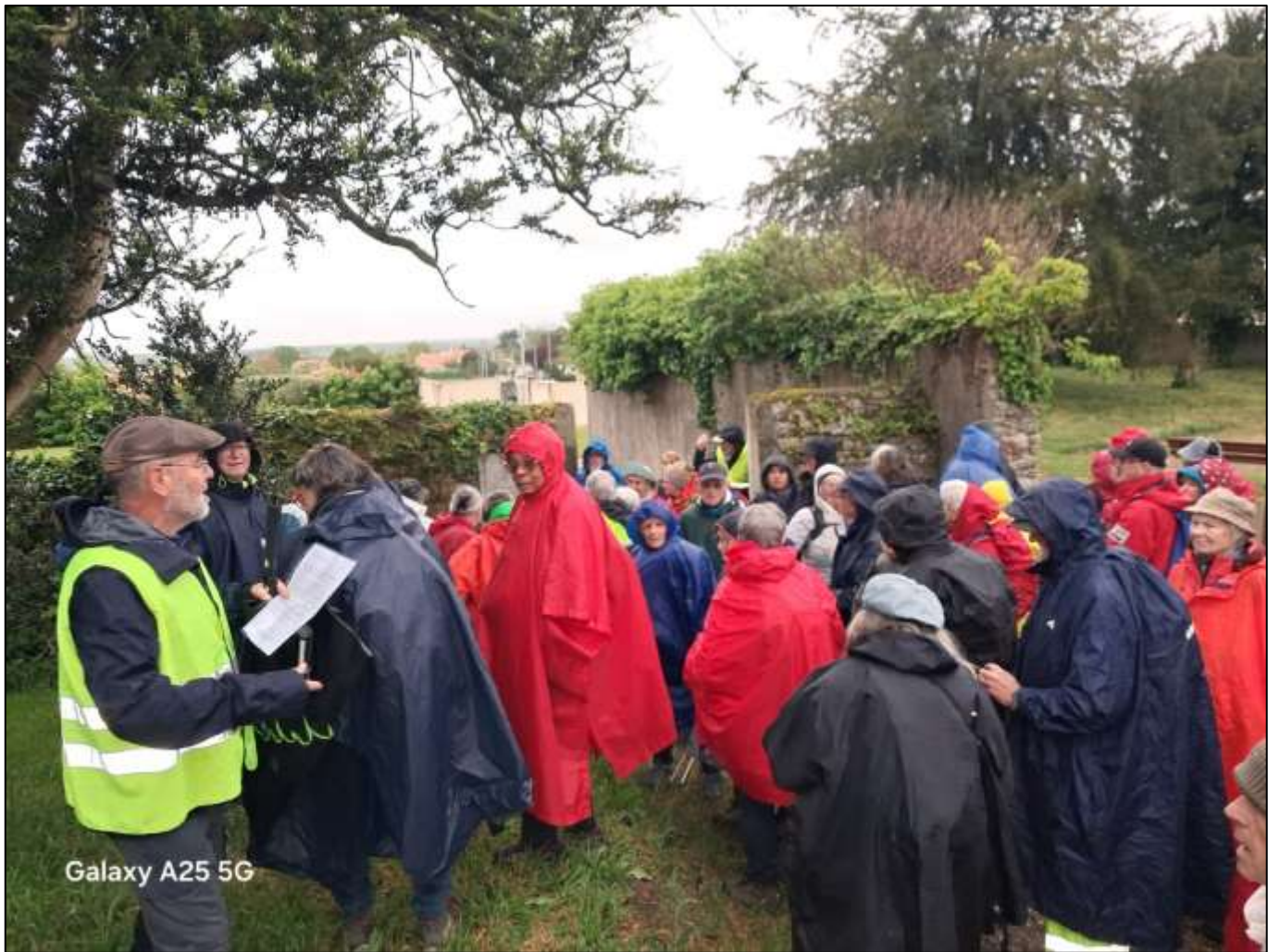
Galaxy A25 5G