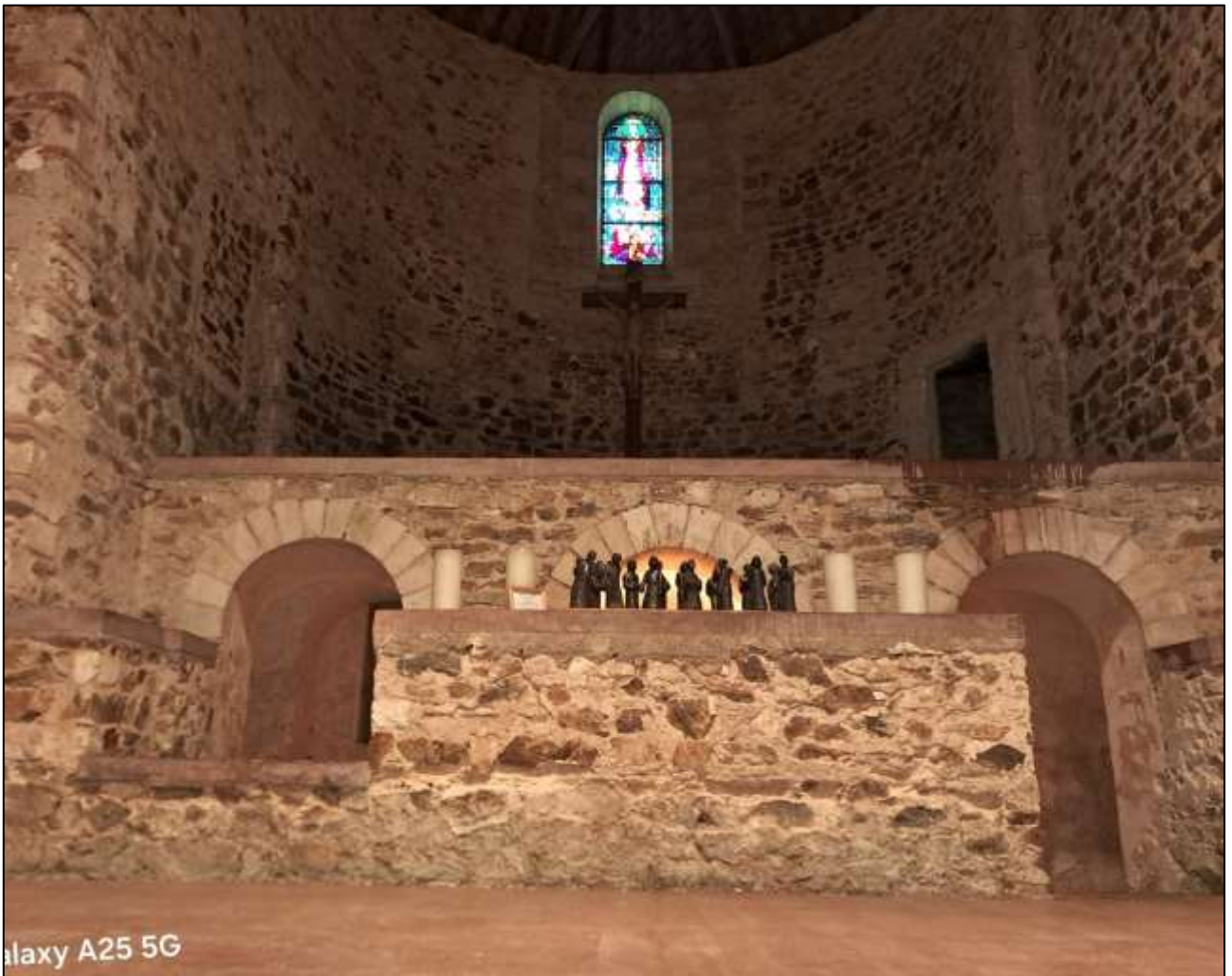
Galaxy A25 5G