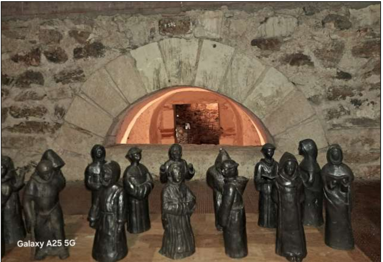
Galaxy A25 5G