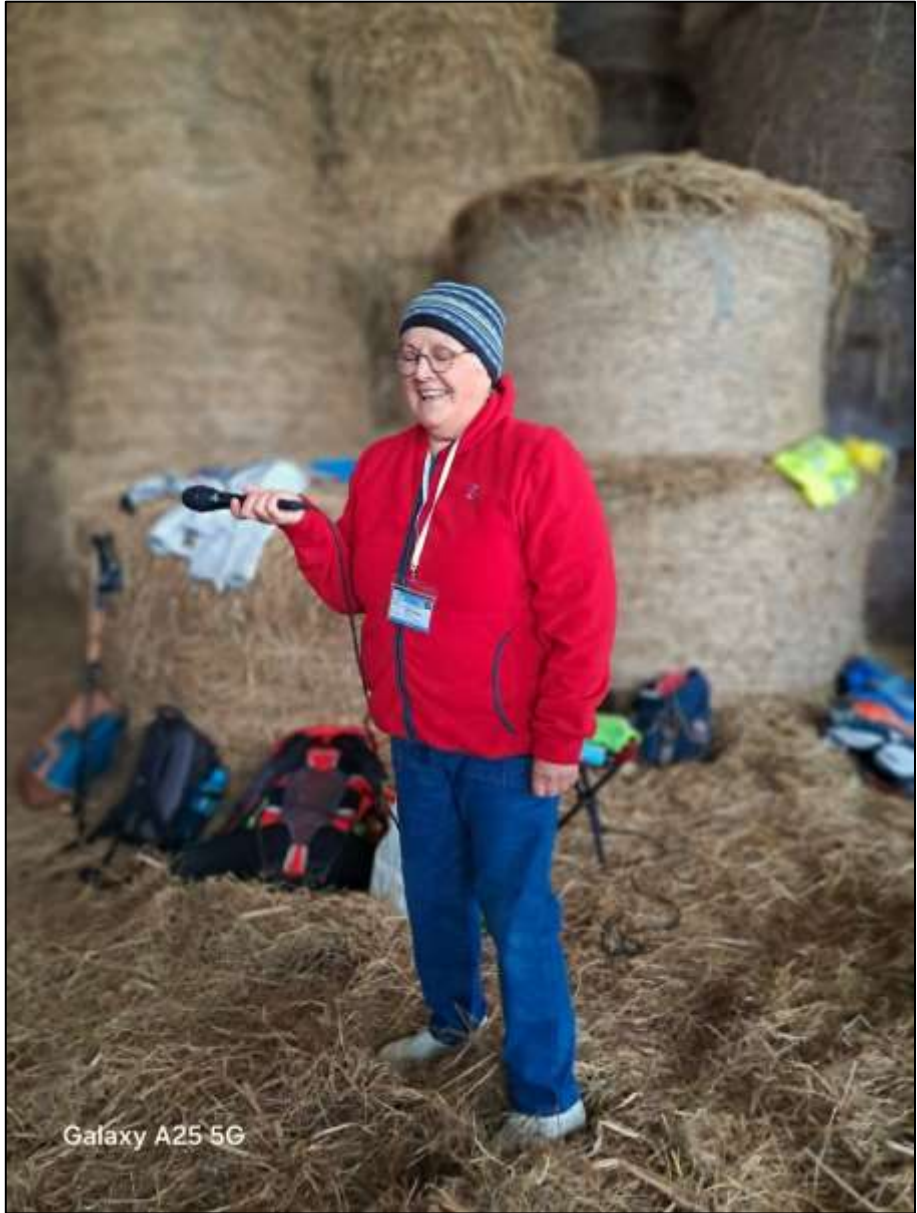
Galaxy A25 5G