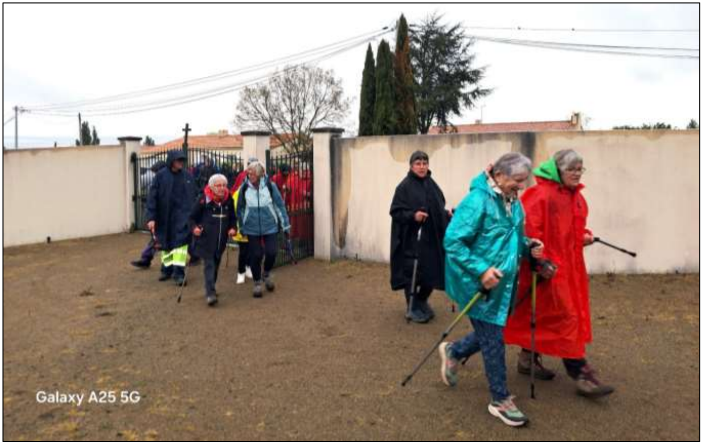
Galaxy A25 5G